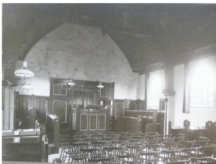
het oorspronkelijke interieur