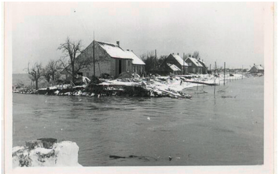
De Schenkeldijk bij de Zuidachterweg in Zuid-Beijerland